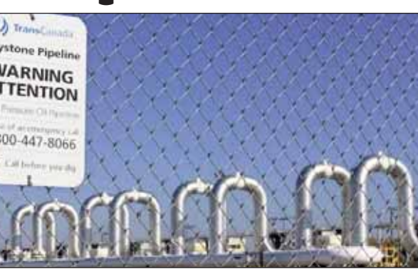
ਕੀਅਸਟੋਨ ਐਕਸ਼ਨ ਪਾਈਪਲਾਈਨ ਦੇ ਨਿਰਮਾਣ ਲਈ ਲੋੜੀਂਦੇ ਪਰਮਿਟ ਨੂੰ ਰੱਦ ਕਰ ਦਿੱਤਾ।

ਕੈਲਗਰੀ, 21 ਜਨਵਰੀ (ਪੋਸਟ ਬਿਊਰੋ) : ਅਮਰੀਕਾ ਦੇ ਰਾਸ਼ਟਰਪਤੀ ਜੋਅ ਬਾਇਡਨ ਨੇ ਬੁੱਧਵਾਰ ਨੂੰ ਰਸਮੀ ਤੌਰ ਉੱਤੇ ਕੀਅਸਟੋਨ ਐਕਸ਼ਨ ਪਾਈਪਲਾਈਨ ਦੇ ਨਿਰਮਾਣ ਲਈ ਲੋੜੀਂਦੇ ਪਰਮਿਟ ਨੂੰ ਰੱਦ ਕਰ ਦਿੱਤਾ। ਇਸ ਨਾਲ ਲੰਮੇ ਸਮੇਂ ਤੋਂ ਸੰਘਰਸ਼ ਕਰ ਰਹੇ ਕੈਨੇਡਾ ਦੇ ਕੱਚੇ ਤੇਲ ਦੇ ਸੈਕਟਰ ਨੂੰ ਵੱਡੀ ਢਾਹ ਲੱਗੀ ਹੈ। ਕੈਨੇਡਾ ਇਸ 8 ਬਿਲੀਅਨ ਡਾਲਰ ਦੇ ਪ੍ਰੋਜੈਕਟ ਉੱਤੇ ਕਾਫੀ ਸਮੇਂ ਤੋਂ ਟੋਕ ਲਾਈ ਬੈਠਾ ਹੈ।