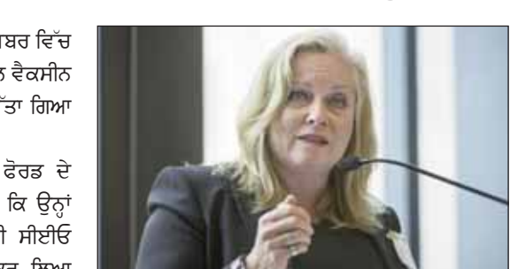
ਵੈਕਸੀਨ ਟਾਸਕ ਫੋਰਸ ਦੀ ਮੈਂਬਰ ਨੇ ਦਿੱਤਾ ਅਸਤੀਫਾ।

ਓਟਵਾ, 21 ਜਨਵਰੀ (ਪੋਸਟ ਬਿਊਰੋ) : ਦਸੰਬਰ ਵਿੱਚ ਦੇਸ਼ ਤੋਂ ਬਾਹਰ ਟਰੈਵਲ ਕਰਨ ਵਾਲੀ ਪ੍ਰੋਜੈਕਟ ਵੈਕਸੀਨ ਟਾਸਕ ਫੋਰਸ ਦੀ ਮੈਂਬਰ ਵੱਲੋਂ ਅਸਤੀਫਾ ਦੇ ਦਿੱਤਾ ਗਿਆ ਹੈ।