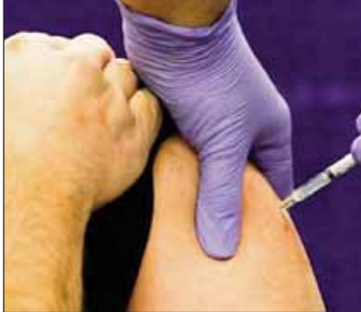
ਬਾਇਓਐਨਟੈਕ ਵੈਕਸੀਨ ਦੇ ਹੋਰ ਰੈਸੀਪੀਐਂਟਸ ਨੂੰ ਆਪਣਾ ਦੂਜਾ ਸ਼ੋਟ 21 ਤੋਂ 27 ਦਿਨਾਂ ਦੇ ਅੰਦਰ ਹਾਸਲ ਹੋਵੇਗਾ। ਜਿਨ੍ਹਾਂ ਵਿਅਕਤੀਆਂ ਨੂੰ ਮੌਡਰਨਾ ਵੈਕਸੀਨ ਦੀ

ਪਹਿਲੀ ਡੋਜ਼ ਲਗ ਚੁੱਕੀ ਹੈ ਉਨ੍ਹਾਂ ਨੂੰ 28 ਦਿਨਾਂ ਦੇ ਬਾਅਦ ਹੀ ਦੂਜੀ ਡੋਜ਼ ਮਿਲੇਗੀ। ਇਸ ਦੇ ਸਭਿਉਲ ਵਿੱਚ ਕੋਈ ਤਬਦੀਲੀ ਨਹੀਂ ਕੀਤੀ ਗਈ ਹੈ। ਪ੍ਰੋਵਿੰਸ ਦਾ ਕਹਿਣਾ ਹੈ ਕਿ ਜੇ ਤੁਹਾਨੂੰ ਵੈਕਸੀਨ ਦੀ ਪਹਿਲੀ ਡੋਜ਼ ਹਾਸਲ ਹੈ ਤਾਂ ਦੂਜੀ ਡੋਜ਼ ਦੇ ਸਭਿਉਲ ਵਿੱਚ ਹੋਣ ਵਾਲੀ ਕਿਸੇ ਵੀ ਤਰ੍ਹਾਂ ਦੀ ਤਬਦੀਲੀ ਬਾਰੇ ਤੁਹਾਨੂੰ ਤੁਹਾਡੀ ਵੈਕਸੀਨ ਸਾਈਟ ਵੱਲੋਂ ਸੰਬੰਧਤ ਕੀਤਾ ਜਾਵੇਗਾ। ਦੂਜੇ ਪਾਸੇ ਫਾਈਜ਼ਰ-ਬਾਇਓਐਨਟੈਕ ਨੇ ਦੱਸਿਆ ਕਿ ਯੂਰਪੀ ਮੈਨੂਫੈਕਚਰਿੰਗ ਫੈਸਿਲਿਟੀ ਵਿੱਚ ਕੰਮ ਦੇ ਪਸਾਰ ਕਾਰਨ ਕੋਵਿਡ-19 ਦੀ ਵੈਕਸੀਨ ਦੇ ਉਤਪਾਦਨ ਉੱਤੇ ਕੁੱਝ ਹਫਤਿਆਂ ਲਈ ਅਸਰ ਪਵੇਗਾ। ਨਤੀਜੇ ਵਜੋਂ ਫਾਈਜ਼ਰ ਵੱਲੋਂ ਆਰਜ਼ੀ ਤੌਰ ਉੱਤੇ ਸਾਰੇ ਦੇਸ਼ਾਂ ਨੂੰ ਸਪਲਾਈ ਘਟਾਈ ਜਾ ਰਹੀ ਹੈ।