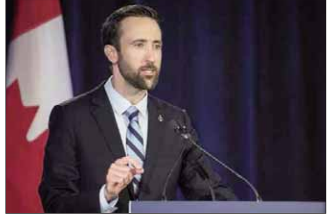
ਜਾਵੇਗਾ। ਪਾਰਟੀ ਦੀ ਸੋਚ ਬਾਰੇ ਪਤਾ ਹੋਣ ਦੇ ਬਾਵਜੂਦ ਕਿਸੇ ਅਜਿਹੇ ਸ਼ਖਸ ਓਟੂਲ ਨੇ ਡੋਨੇਸ਼ਨ ਲੈਣਾ ਬਹੁਤ ਵੱਡੀ ਗਲਤੀ ਹੈ ਜਿਹੜਾ ਨਸਲ ਦੇ ਆਧਾਰ ਉੱਤੇ ਫਰਕ ਕਰਦਾ ਹੋਵੇ। ਹਾਲਾਂਕਿ ਇਹ ਕੰਜਰਵੇਟਿਵ ਐਮਪੀਜ਼ ਉੱਤੇ ਨਿਰਭਰ ਕਰਦਾ ਸੀ ਕਿ ਉਹ ਸਲੋਨ ਨੂੰ ਪਾਰਟੀ ਵਿੱਚੋਂ ਬਾਹਰ

ਓਟਵਾ, 21 ਜਨਵਰੀ (ਪੋਸਟ ਬਿਊਰੋ) : ਕੰਜਰਵੇਟਿਵ ਆਗੂ ਐਰਿਕ ਓਟੂਲ ਨੇ ਓਨਟਾਰੀਓ ਤੋਂ ਐਮਪੀ ਡੈਰੇਕ ਸਲੋਨ ਨੂੰ ਪਾਰਟੀ ਕਾਕਸ ਤੋਂ ਬਾਹਰ ਕਰ ਦਿੱਤਾ ਹੈ। ਓਟੂਲ ਵੱਲੋਂ ਅਜਿਹਾ ਫੈਸਲਾ ਲੀਡਰਸ਼ਿਪ ਕੈਂਪੇਨ ਦੌਰਾਨ ਸਲੋਨ ਵੱਲੋਂ ਵਾਧੂ ਸੁਪਰੀਮਿਸਟ ਕੋਲੋਂ ਲਈ ਗਈ ਡੋਨੇਸ਼ਨ ਕਾਰਨ ਕੀਤਾ ਗਿਆ। ਸੋਮਵਾਰ ਨੂੰ ਜਾਰੀ ਕੀਤੇ ਇੱਕ ਬਿਆਨ ਵਿੱਚ ਓਟੂਲ ਨੇ ਆਖਿਆ ਕਿ ਨਸਲਵਾਦ ਇੱਕ ਬਿਮਾਰੀ ਹੈ ਤੇ ਇਹ ਸਾਡੀ ਪਾਰਟੀ ਦੀਆਂ ਕਦਰਾਂ ਕੀਮਤਾਂ ਤੋਂ ਉਲਟ ਹੈ। ਸਾਡੇ ਦੇਸ਼ ਵਿੱਚ ਇਸ ਲਈ ਕੋਈ ਥਾਂ ਨਹੀਂ। ਇਹ ਸੱਭ ਸਾਡੀ ਪਾਰਟੀ ਵਿੱਚ ਬਰਦਾਸ਼ਤ ਨਹੀਂ ਕੀਤਾ