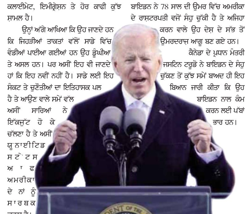
ਜੋਅ ਬਾਇਡਨ ਨੇ ਅਮਰੀਕਾ ਦੇ 46ਵੇਂ ਰਾਸ਼ਟਰਪਤੀ ਵਜੋਂ ਸੰਗ ਚੁੱਕੀ ਹੈ।

ਬਾਇਡਨ ਨੇ ਦੋਵਾਂ ਪਾਰਟੀਆਂ ਦੇ ਆਪਣੇ ਪੁਰਾਣੇ ਆਗੂਆਂ ਵੱਲੋਂ ਇਨ੍ਹਾਂ ਜਸਨਾਂ ਦਾ ਹਿੱਸਾ ਬਣਨ ਉੱਤੇ ਉਨ੍ਹਾਂ ਦਾ ਧੰਨਵਾਦ ਕੀਤਾ। ਇਸ ਮੌਕੇ ਸਾਬਕਾ ਵਾਈਸ ਪ੍ਰੈਜ਼ੀਡੈਂਟ ਮਾਈਕ ਪੋਂਸ ਤਾਂ ਹਜ਼ਰ ਹੋਏ ਪਰ ਸਾਬਕਾ ਰਾਸ਼ਟਰਪਤੀ ਡੋਨਲਡ ਟਰੰਪ ਸਵੇਰ ਸਮੇਂ ਹੀ ਫਲੋਰਿਡਾ ਰਵਾਨਾ ਹੋ ਗਏ। ਆਪਣੇ ਪਹਿਲੇ ਦਿਨ ਬਾਇਡਨ ਕਈ ਤਰ੍ਹਾਂ ਦੇ ਐਗਜ਼ੈਕਟਿਵ ਐਕਸ਼ਨ ਲੈਣਗੇ, ਜਿਨ੍ਹਾਂ ਵਿੱਚ ਮਹਾਂਮਾਰੀ, ਕਲੀਮੈਂਟ, ਇਮੀਗ੍ਰੇਸ਼ਨ ਤੇ ਹੋਰ ਕਾਫੀ ਕੁੱਝ ਬਾਇਡਨ ਨੇ 78 ਸਾਲ ਦੀ ਉਮਰ ਵਿੱਚ ਅਮਰੀਕਾ ਦੇ ਰਾਸ਼ਟਰਪਤੀ ਵਜੋਂ ਸੰਗ ਚੁੱਕੀ ਹੈ ਤੇ ਅਜਿਹਾ ਕਰਨ ਵਾਲੇ ਉਹ ਦੋਸ਼ ਦੇ ਸਭ ਤੋਂ ਉਮਰਦਰਾਜ਼ ਆਗੂ ਬਣ ਗਏ ਹਨ।