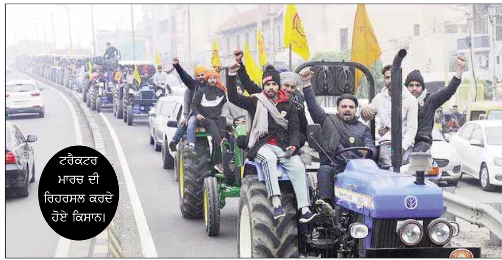
ਟਰੈਕਟਰ ਮਾਰਚ ਦੀ ਰਿਹਾਸਲ ਕਰਦੇ ਹੋਏ ਕਿਸਾਨ।

ਨਵੀਂ ਦਿੱਲੀ, 21 ਜਨਵਰੀ, (ਪੋਸਟ ਬਿਊਰੋ)- ਭਾਰਤ ਸਰਕਾਰ ਦੇ ਤਿੰਨ ਨਵੇਂ ਖੇਤੀ ਕਾਨੂੰਨਾਂ ਵਿਰੁੱਧ ਸੰਘਰਸ਼ ਕਰ ਰਹੇ ਸਾਥੇ ਕਿਸਾਨ ਮੋਰਚੇ ਦੀ ਅੱਜ ਵੀਰਵਾਰ ਦੀ ਮੀਟਿੰਗ ਨੇ ਇੱਕ ਦਿਨ ਪਹਿਲਾਂਕੇਂਦਰ ਸਰਕਾਰ ਵੱਲੋਂ ਕੀਤੀਆਂ ਹਰ ਕਿਸਮ ਦੀਆਂ ਖੇਸ਼ਕਸ਼ਾਂ ਨੂੰ ਰੱਦ ਕਰ ਦਿੱਤਾ ਅਤੇ ਤਿੰਨ ਕਾਨੂੰਨ ਰੱਦ ਕਰਨ ਦੇ ਨਾਲ ਦੇਸ਼ ਦੇ ਕਿਸਾਨਾਂ ਨੂੰ ਸਾਰੀਆਂ ਫਸਲਾਂ ਉੱਤੇ ਖੱਟੋ-ਖੱਟ ਖਰੀਦ ਕੀਮਤ (ਐਮਐਸਪੀ) ਦੇਣ ਲਈ ਕਾਨੂੰਨ ਲਾਗੂ ਕਰਨ ਦੀ ਮੰਗ ਫਿਰ ਦੁਹਰਾਈ ਹੈ। ਕਿਸਾਨ ਮੋਰਚਾ ਨੇ ਅੱਜ ਦੀ ਬੈਠਕ ਦੌਰਾਨ ਅੰਦੋਲਨ ਵਿਚ ਅੱਜ ਤੱਕ ਸ਼ਾਮਲ ਹੋਏ 147 ਕਿਸਾਨਾਂ ਨੂੰ ਸੁਰਖਿਅਕੀ ਦੇ ਕੇ ਕਿਹਾ ਕਿ ਸਾਡੇ ਤੋਂ ਵਿਛੜ ਰਹੇ ਸਾਡੇ ਸਾਥੀਆਂ ਦੀ ਕੁਰਬਾਨੀ ਵਿਅਰਥ ਨਹੀਂ ਜਾਣ ਦਿੱਤੀ ਜਾਵੇਗੀ। ਇਸ ਦੌਰਾਨ ਅੱਜ ਦਿੱਲੀ ਪੁਲਿਸ ਦੇ ਅਧਿਕਾਰੀਆਂ ਨਾਲ ਹੋਈ ਬੈਠਕ ਦੌਰਾਨ ਪੁਲਿਸ ਨੇ ਇੱਕ ਵਾਰ ਫਿਰ