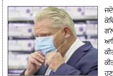
ਫੋਰਡ ਦੀ ਹਰਮਨ ਪਿਆਰਤਾ ਵਿੱਚ ਆਈ ਕਮੀ।

ਜਦੋਂ ਆਮ ਤੌਰ ਉੱਤੇ ਫੋਰਡ ਵੱਲੋਂ ਕੋਵਿਡ-19 ਵਾਲੀ ਸਥਿਤੀ ਨੂੰ ਸਾਫ਼ਤ ਦੀ ਗੱਲ ਆਖੀ ਗਈ ਤਾਂ 27 ਫੀ ਸਦੀ ਨੇ ਆਖਿਆ ਕਿ ਉਨ੍ਹਾਂ ਨੇ ਚੰਗਾ ਕੰਮ ਨਹੀਂ ਕੀਤਾ ਤੇ ਕਈ ਬੱਚਰ ਗਲਤੀਆਂ ਕੀਤੀਆਂ। ਤਿੰਨ ਮਹੀਨੇ ਪਹਿਲਾਂ ਨਾਲੋਂ ਹੁਣ ਇਸ ਰੋਟਿੰਗ ਵਿੱਚ ਅੱਠ ਫੀ ਸਦੀ ਦੀ ਗਿਰਾਵਟ ਆਈ ਹੈ। ਫੋਰਡ ਦੀ ਹਰਮਨ ਪਿਆਰਤਾ ਵਿੱਚ ਆਈ ਕਮੀ ਦੇ ਬਾਵਜੂਦ ਉਨ੍ਹਾਂ ਦੇ ਵਿਚੋਂ ਕੋਈ ਫਾਇਦਾ ਨਹੀਂ ਹੋਇਆ। ਲਿਬਰਲ ਆਗੂ ਸਟੀਵਨ ਡੋਲ ਡੂਕਾ ਤੇ ਐਨਡੀਪੀ ਆਗੂ ਐਂਡਰੀਆ ਹੋਰਬੇ ਦੇ ਸਕਾਰਾਤਮਕ ਰੁਖ ਵਿੱਚ ਵੀ ਮਾਮੂਲੀ ਗਿਰਾਵਟ ਦਰਜ ਕੀਤੀ ਗਈ ਹੈ। ਜੇ ਅੱਜ ਚੋਣਾਂ ਕਰਵਾ ਲਈਆਂ ਜਾਣ ਤਾਂ ਸਰਵੇਖਣ ਵਿੱਚ ਹਿੱਸਾ ਲੈਣ ਵਾਲੇ 34 ਫੀ ਸਦੀ ਲੋਕਾਂ ਦਾ ਕਹਿਣਾ ਸੀ ਕਿ ਉਹ ਫੋਰਡ ਨੂੰ ਵੋਟ ਪਾਉਣਗੇ, 29 ਫੀ ਸਦੀ ਨੇ ਆਖਿਆ ਕਿ ਉਹ ਲਿਬਰਲਾਂ ਨੂੰ ਵੋਟ ਕਰਨਗੇ ਤੇ 25 ਫੀ ਸਦੀ ਨੇ ਐਨਡੀਪੀ ਦੇ ਪੱਖ ਵਿੱਚ ਵੋਟ ਪਾਉਣ ਦੀ ਗੱਲ ਆਖੀ। ਵੈਕਸੀਨ ਦੀ ਵੰਡ ਨੂੰ ਲੈ ਕੇ ਵੀ 57 ਫੀ ਸਦੀ ਲੋਕਾਂ ਦਾ ਮੰਨਣਾ ਹੈ ਕਿ ਇਹ ਵੰਡ ਬਹੁਤ ਮਤੇ ਢੰਗ ਨਾਲ ਹੋ ਰਹੀ ਹੈ। ਸਿਆਸਤਦਾਨਾਂ ਤੇ ਅਧਿਕਾਰੀਆਂ ਵੱਲੋਂ ਵੈਕਸੀਨ ਉੱਤੇ ਜਾਣ ਦੇ ਮਾਮਲੇ ਵਿੱਚ 87 ਫੀ ਸਦੀ ਨੇ ਆਖਿਆ ਕਿ ਅਜਿਹਾ ਬਿਲਕੁਲ ਵੀ ਸਵੀਕਾਰ ਨਹੀਂ ਕੀਤਾ ਜਾ ਸਕਦਾ ਤੇ 75 ਫੀ ਸਦੀ ਨੇ ਆਖਿਆ ਕਿ ਅਜਿਹਾ ਬਿਲਕੁਲ ਵੀ ਸਵੀਕਾਰ ਨਹੀਂ ਕੀਤਾ ਜਾ ਸਕਦਾ। ਅਧਿਕਾਰੀਆਂ ਤੇ ਅਧਿਕਾਰੀਆਂ ਵਿੱਚ ਵੱਡੇ ਟਰੇਵਲ ਕਰਨ ਦੇ ਮਾਮਲੇ ਨੂੰ ਫੋਰਡ ਨੇ ਚੰਗੀ ਤਰ੍ਹਾਂ ਹੈਂਡਲ ਨਹੀਂ ਕੀਤਾ।