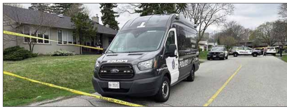
ਹਿਰਾਸਤ ਵਿੱਚ ਲੈ ਲਿਆ ਗਿਆ। ਮਾਮਲੇ ਦੀ ਜਾਂਚ ਕੀਤੀ ਜਾ ਰਹੀ ਹੈ ਪਬਲਿਕ ਸੇਫਟੀ ਨੂੰ ਕੋਈ ਖਤਰਾ ਤੇ ਪੁਲਿਸ ਦਾ ਕਹਿਣਾ ਹੈ ਕਿ ਨਹੀਂ ਹੈ।

ਇਟੋਬੀਕੋ, 18 ਅਪਰੈਲ (ਪੋਸਟ ਬਿਊਰੋ) : ਵੀਰਵਾਰ ਦੁਪਹਿਰ ਨੂੰ ਇਟੋਬੀਕੋ ਵਿੱਚ ਫੂਰੇਬਾਜ਼ੀ ਕਾਰਨ ਇੱਕ ਵਿਅਕਤੀ ਦੀ ਮੌਤ ਹੋ ਗਈ। ਕਿਪਲਿੰਗ ਐਵਨਿਊ ਦੇ ਪੂਰਬ ਵਿੱਚ ਐਗਲਿੰਟਨ ਐਵਨਿਊ ਵੈਸਟ ਨੇੜੇ ਪ੍ਰਿੰਸੈੱਸ ਐਨ ਕ੍ਰੀਸਟ ਤੇ ਬਰਨਮਾਉਥ ਰੋਡ ਉੱਤੇ ਸਥਿਤ ਘਰ ਵਿੱਚ ਪੁਲਿਸ ਨੂੰ ਫੂਰੇਬਾਜ਼ੀ ਦੀਆਂ ਖਬਰਾਂ ਦੇ ਕੇ ਦੁਪਹਿਰੇ 2:00 ਵਜੇ ਤੋਂ ਬਾਅਦ ਸੱਦਿਆ ਗਿਆ। ਇੱਕ ਵਿਅਕਤੀ ਨੂੰ ਮੌਕੇ ਉੱਤੇ ਹੀ ਮ੍ਰਿਤਕ ਐਲਾਨ ਦਿੱਤਾ ਗਿਆ ਜਦਕਿ ਦੂਜੇ ਨੂੰ