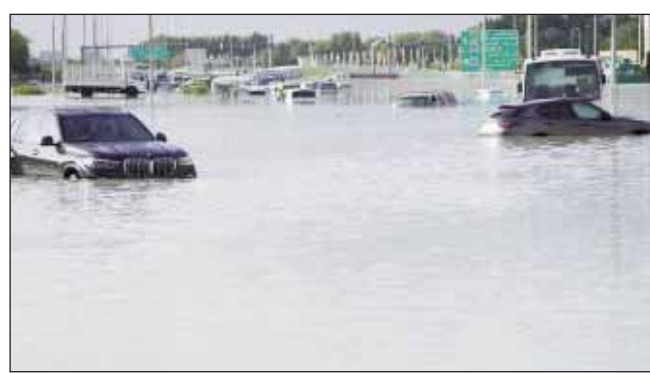
ਅੱਡੇ 'ਤੇ ਪਿਛਲੇ 24 ਘੰਟਿਆਂ ਦੌਰਾਨ 6.26 ਇੰਚ ਤੋਂ ਵੱਧ ਮੀਂਹ ਪਿਆ ਹੈ। ਮੌਸਮ ਸੰਬੰਧੀ ਜਾਣਕਾਰੀ ਦੇਣ ਵਾਲੀ ਵੈੱਬਸਾਈਟ 'ਦਿ ਵੇਦਰਮੈਨ ਡਾਟ ਕਮ'

ਯੂ.ਏ.ਈ., 18 ਅਪ੍ਰੈਲ (ਪੋਸਟ ਬਿਊਰੋ): 15 ਅਪ੍ਰੈਲ ਦੀ ਰਾਤ ਨੂੰ ਯੂ.ਏ.ਈ., ਸਾਊਦੀ ਅਰਬ, ਬਹਿਰੀਨ ਅਤੇ ਓਮਾਨ ਵਿੱਚ ਭਾਰੀ ਮੀਂਹ ਸ਼ੁਰੂ ਹੋ ਗਿਆ। ਕੁਝ ਹੀ ਸਮੇਂ ਵਿੱਚ ਇਹ ਤੁਫਾਨ ਵਿੱਚ ਬਦਲਣ ਲੱਗਾ। ਹਾਲਾਤ ਇਹ ਬਣ ਗਏ ਕਿ ਮੰਗਲਵਾਰ ਤੱਕ ਇਨ੍ਹਾਂ ਦੇਸ਼ਾਂ ਦੇ ਦਰਜਨਾਂ ਸ਼ਹਿਰ ਇਸ ਕਾਰਨ ਹੜ੍ਹ ਦੀ ਲਪੇਟ 'ਚ ਆ ਚੁੱਕੇ ਹਨ। ਮਾਰੂਥਲ ਦੇ ਵਿਚਕਾਰ ਸਥਿਤ ਦੁਬਈ ਦੇ ਅੰਤਰਰਾਸ਼ਟਰੀ ਹਵਾਈ