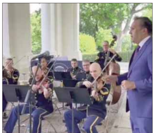
ਅਮਰੀਕੀ ਭਾਈਚਾਰੇ ਦੇ ਆਗੂ ਉਪਰਾਸ਼ਟਰਪਤੀ ਕਮਲਾ ਹੈਰਿਸ ਹਨ। ਇਸ ਪ੍ਰੋਗਰਾਮ ਵਿੱਚ ਵੀ ਮੌਜੂਦ ਸਨ।