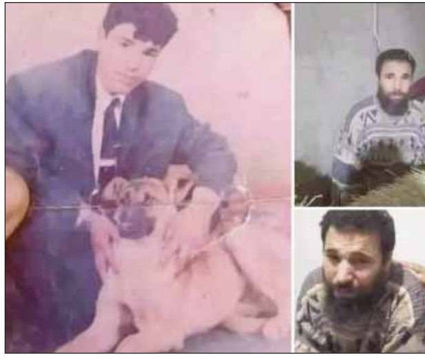
ਉਸ 'ਤੇ ਕਾਲਾ ਜਾਦੂ ਕੀਤਾ ਸੀ।

ਉਸ ਦੇ ਪਰਿਵਾਰ ਨੇ ਕਈ ਸਾਲਾਂ ਤੱਕ ਉਸ ਦੀ ਭਾਲ ਕੀਤੀ। ਪਰ ਜਦੋਂ ਨਾ ਮਿਲਿਆ ਤਾਂ ਉਨ੍ਹਾਂ ਨੇ ਉਸ ਨੂੰ ਮਰਿਆ ਸਮਝ ਲਿਆ। ਅਗਵਾਕਾਰ ਦਾ ਘਰ ਉਮਰ ਦੇ ਘਰ ਤੋਂ ਮਹਿਜ਼ 200 ਮੀਟਰ ਦੀ ਦੂਰੀ 'ਤੇ ਸੀ। ਰਿਪੋਰਟਾਂ ਅਨੁਸਾਰ, ਉਮਰ ਕਦੇ ਵੀ ਉੱਥੇ ਭੱਜ ਨਹੀਂ ਸਕਿਆ ਕਿਉਂਕਿ ਅਗਵਾਕਾਰ ਨੇ