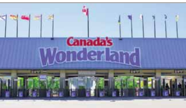
ਸਿਕਸ ਫਲੈਗਜ਼ ਇੰਟਰਟੇਨਮੈਂਟ ਕਾਰ-ਪੋਰੇਸ਼ਨ ਦੀ ਇੱਕ ਸਹਾਇਕ ਕੰਪਨੀ ਵੰਡਰਲੈਂਡ ਵਿਰੁੱਧ ਬਿਊਰੋ ਦੀ ਅਰਜ਼ੀ ਸੋਮਵਾਰ ਨੂੰ ਕੰਪੀਟੀਸ਼ਨ ਟ੍ਰਿਬਿਊਨਲ ਕੋਲ ਦਾਇਰ ਕੀਤੀ ਗਈ ਸੀ।

ਵਾਧੂ ਖਰਚਿਆਂ ਨੂੰ ਲੁਕਾਇਆ ਜਾਂਦਾ ਹੈ। ਬਿਊਰੋ ਦਾ ਦੋਸ਼ ਹੈ ਕਿ ਵੰਡਰਲੈਂਡ, ਖਾਸ ਤੌਰ 'ਤੇ, ਖਪਤਕਾਰਾਂ ਨੂੰ ਆਨਲਾਈਨ ਭੁਗਤਾਨ ਕਰਨ ਵਾਲੇ ਮੁੱਲ ਨਾਲੋਂ ਘੱਟ ਕੀਮਤ 'ਤੇ ਚੀਜ਼ਾਂ ਦਾ ਇਸ਼ਤਿਹਾਰ ਦਿੰਦਾ ਹੈ। ਅਸੀਂ ਵੰਡਰਲੈਂਡ ਵਿਰੁੱਧ ਕਾਰਵਾਈ ਕਰ ਰਹੇ ਹਾਂ ਕਿਉਂਕਿ ਡਿੱਪ ਕੀਮਤ ਵਰਗੀਆਂ ਗੁੰਮਰਾਹਕੁੰਨ ਚਾਲਾਂ ਸਿਰਫ ਖਪਤਕਾਰਾਂ ਨੂੰ ਖੋਬਾ ਦੇਣ ਅਤੇ ਨੁਕਸਾਨ ਪਹੁੰਚਾਉਣ ਲਈ ਕੰਮ ਕਰਦੀਆਂ ਹਨ। ਵੰਡਰਲੈਂਡ, ਜੋਕ ਵਾਨ, ਓਟਾਰੀਓ ਵਿੱਚ ਸਥਿਤ ਹੈ, ਯੂ.ਐੱਸ.-ਅਧਾਰਤ