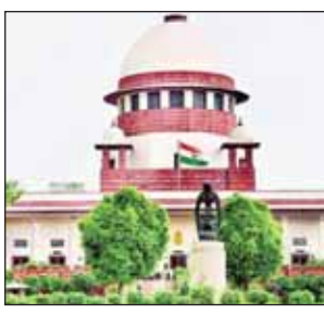
ਦੀ ਦੁਰਵਰਤੋਂ ਹੋਵੇਗੀ।

ਨਵੀਂ ਦਿੱਲੀ, 6 ਮਾਰਚ (ਪੋਸਟ ਬਿਊਰੋ): ਸੁਪਰੀਮ ਕੋਰਟ ਨੇ ਇੱਕ ਮਾਮਲੇ ਵਿੱਚ ਕਿਹਾ ਕਿ 16 ਸਾਲ ਤੱਕ ਲਿਵ-ਇਨ ਰਿਲੇਸ਼ਨਸ਼ਿਪ ਵਿੱਚ ਰਹਿਣ ਤੋਂ ਬਾਅਦ ਕੋਈ ਔਰਤ ਬਲਾਤਕਾਰ ਦਾ ਦੋਸ਼ ਨਹੀਂ ਲਗਾ ਸਕਦੀ। ਸਿਰਫ਼ ਵਿਆਹ ਕਰਨ ਦਾ ਵਾਅਦਾ ਤੋੜਨਾ ਹੀ ਬਲਾਤਕਾਰ ਦਾ ਮਾਮਲਾ ਨਹੀਂ ਬਣਦਾ, ਜਦੋਂ ਤੱਕ ਇਹ ਸਾਬਤ ਨਾ ਹੋ ਜਾਵੇ ਕਿ ਸੁਰੂ ਤੋਂ ਹੀ ਵਿਆਹ ਕਰਨ ਦਾ ਕੋਈ ਇਰਾਦਾ ਨਹੀਂ ਸੀ।