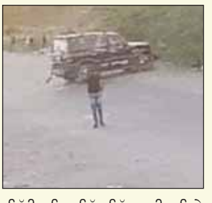
ਸਿੱਧੀ ਨਹਿਰ ਵਿੱਚ ਡਿੱਗ ਗਈ। ਕਿਸੇ ਤਰ੍ਹਾਂ ਤਿੰਨ ਬਾਹਰ ਆ ਗਏ। ਅਸੀਂ ਬਾਕੀ ਦੋਸਤਾਂ ਅਤੇ ਆਸ-ਪਾਸ ਦੇ ਲੋਕਾਂ ਨੇ ਰੱਸੀਆਂ ਸੁਟ ਕੇ ਉਨ੍ਹਾਂ ਨੂੰ ਬਚਾਉਣ ਦੀ ਕੋਸ਼ਿਸ਼ ਕੀਤੀ, ਪਰ ਪਾਣੀ ਦੇ ਤੇਜ਼ ਵਹਾਅ ਵਿੱਚ ਤਿੰਨਾਂ ਹੀ ਵਹਿ ਗਏ।

ਅਹਿਮਦਾਬਾਦ, 6 ਮਾਰਚ (ਪੋਸਟ ਬਿਊਰੋ): ਗੁਜਰਾਤ ਦੇ ਅਹਿਮਦਾਬਾਦ ਵਿੱਚ ਇੱਕ ਸਕਾਰਯੋਗ ਸਮੇਤ ਨਹਿਰ ਵਿੱਚ ਡਿੱਗਣ ਦੀ ਘਟਨਾ ਸਾਹਮਣੇ ਆਈ ਹੈ। ਕਾਰ ਵਿੱਚ ਤਿੰਨ ਦੋਸਤ ਸਵਾਰ ਸਨ, ਜਿਨ੍ਹਾਂ ਵਿੱਚੋਂ ਦੋ ਦੀਆਂ ਲਾਸ਼ਾਂ ਮਿਲ ਗਈਆਂ ਹਨ ਅਤੇ ਤੀਜੇ ਦੀ ਭਾਲ ਜਾਰੀ ਹੈ। ਇਹ ਗਾਦਸਾ ਕਲੂ ਸਮੂਹ, ਬੁੱਧਵਾਰ ਨੂੰ ਹੋਇਆ, ਜਿਸਦੀ ਸੀਸੀਟੀਵੀ ਫੁਟੇਜ ਹੁਣੇ ਸਾਹਮਣੇ ਆਈ ਹੈ।