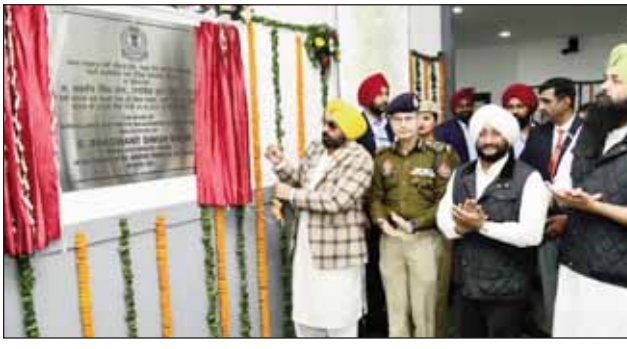
ਕੀਤਾ ਜਾ ਸਕੇ।

ਮੁੱਖ ਮੰਤਰੀ ਨੇ ਕਿਹਾ ਕਿ ਟ੍ਰੈਫਿਕ ਪ੍ਰਬੰਧਨ ਨੂੰ ਸੁਚਾਰੂ ਬਣਾਉਣ, ਜਨਤਕ ਸੁਰੱਖਿਆ ਵਧਾਉਣ ਅਤੇ ਕਾਨੂੰਨ ਲਾਗੂਕਰਨ ਦੇ ਯਤਨਾਂ ਨੂੰ ਹੋਰ ਅੱਗੇ ਵਧਾਉਣ ਲਈ ਤਿਆਰ ਕੀਤੇ ਗਏ