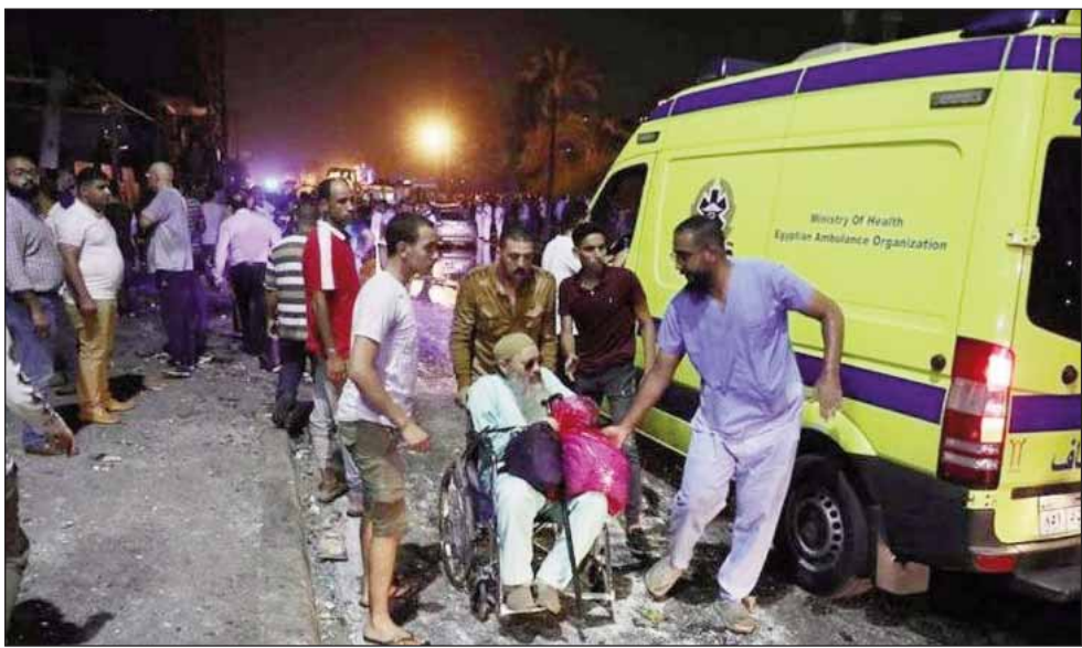
ਜ਼ਖਮੀਆਂ ਨੂੰ ਹਸਪਤਾਲ ਲਿਜਾਏ ਜਾਣ ਦਾ ਇਕ ਦ੍ਰਿਸ਼।

ਕਾਹਿਰਾ, 6 ਅਗਸਤ (ਪੋਸਟ ਬਿਊਰੋ)- ਕਾਹਿਰਾ ਵਿੱਚ ਤੇਜ਼ ਰਫਤਾਰ ਕਾਰ ਦੀ ਸਾਹਮਣੇ ਤੋਂ ਆਏ ਤਿੰਨ ਵਾਹਨਾਂ ਨਾਲ ਹੋਈ ਟੱਕਰ ਪਿਛੋਂ ਹੋਏ ਵੱਡੇ ਧਮਾਕੇ ਵਿੱਚ ਘੱਟੋ-ਘੱਟ 20 ਜਣਿਆਂ ਦੀ ਮੌਤ ਹੋ ਗਈ ਤੇ 47 ਜ਼ਖਮੀ ਹੋ ਗਏ। ਮਿਸਰ ਦੇ ਸਿਹਤ ਮੰਤਰਾਲੇ ਵੱਲੋਂ ਦਿੱਤੀ ਗਈ ਜਾਣਕਾਰੀ ਅਨੁਸਾਰ ਇਹ ਹਾਦਸਾ ਦੇਰ ਰਾਤ ਕੇਂਦਰੀ