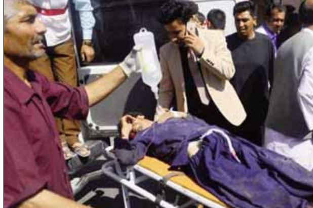
ਜ਼ਖਮੀ ਨੂੰ ਹਸਪਤਾਲ ਲਿਜਾਏ ਸਾਥੀ।

ਕਾਬੁਲ, 6 ਅਗਸਤ (ਪੋਸਟ ਬਿਊਰੋ)- ਇਥੋਂ ਇਕ ਅਫਗਾਨ ਪੁਲਸ ਮੁਲਾਜ਼ਮ ਨੇ ਕੰਧਾਰ ਦੇ ਦੱਖਣੀ ਖਿੱਤੇ ਵਿੱਚ ਆਪਣੇ ਸਾਥੀਆਂ ਨੂੰ ਗੋਲੀਆਂ ਨਾਲ ਭੁੰਨ ਦਿੱਤਾ, ਜਿਸ ਕਾਰਨ ਸੱਤ ਪੁਲਸ ਮੁਲਾਜ਼ਮਾਂ ਦੀ ਮੌਤ ਹੋ ਗਈ। ਮੁਲਜ਼ਮ ਘਟਨਾ ਬਾਅਦ ਮੌਕੇ ਤੋਂ ਫਰਾਰ ਹੋ ਗਿਆ। ਤਾਲਿਬਾਨ ਨੇ ਇਸ ਹਮਲੇ ਦੀ ਜਾਣਕਾਰੀ ਲਈ ਹੈ। ਇਸ ਸੰਬੰਧ ਵਿੱਚ ਤਾਲਿਬਾਨ ਦਾ ਕਹਿਣਾ ਹੈ ਕਿ ਪੁਲਸ ਮੁਲਾਜ਼ਮ ਉਨ੍ਹਾਂ ਦੇ ਗੁਟ ਵਿੱਚ ਸ਼ਾਮਲ ਹੋ ਗਿਆ ਹੈ। ਵਰਨਣ ਯੋਗ ਹੈ ਕਿ ਬੀਤੇ ਹਫਤੇ ਕੰਧਾਰ ਜਿਲੇ ਵਿੱਚ ਇਕ ਅਫਗਾਨ ਫੌਜੀ ਨੇ ਦੋ ਅਮਰੀਕੀ ਜਵਾਨਾਂ ਨੂੰ ਗੋਲੀਆਂ ਮਾਰ ਕੇ ਮਾਰ ਦਿੱਤਾ ਸੀ। ਹਿਰਾਸਤ ਵਿੱਚ ਲਏ ਜ਼ਖਮੀ ਹਮਲਾਵਰ ਨੂੰ ਤਾਲਿਬਾਨ ਨੇ 'ਹੀਰੋ' ਬਣਾ ਦਿੱਤਾ ਸੀ, ਪਰ ਉਸ ਹਮਲੇ ਦੀ ਕਿਸੇ ਗੁਣ ਨੇ ਜ਼ਿੰਮੇਵਾਰੀ ਨਹੀਂ ਲਈ ਸੀ।