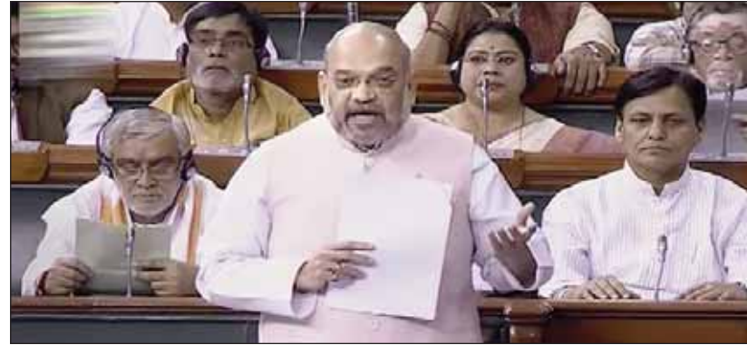
ਨਹੀਂ ਦੱਸੀ ਕਿ ਧਾਰਾ 370 ਕਸ਼ਮੀਰ ਲਈ ਲਾਭਦਾਇਕ ਕਿਵੇਂ ਹੈ। ਅਸੀਂ ਹੁਰੀਅਤ ਕਾਨਫਰੰਸ ਆਗੂਆਂ ਨਾਲ ਗੱਲਬਾਤੀ ਕਰਨਾ ਚਾਹੁੰਦੇ, ਕਸ਼ਮੀਰ ਅਧਿਕਾਰ ਦਾ ਕਾਨੂੰਨ ਉੱਥੇ ਅਜੇ ਤੱਕ ਨਹੀਂ ਬਣਿਆ।

ਚਾਹੁੰਦੇ ਹਨ ਕਿ 370 ਹਟ ਜਾਵੇ, ਪਰ ਉਨ੍ਹਾਂ ਅੱਗੇ ਵੱਟ ਬੈਠ ਕੇ ਸਵਾਲ ਆ ਜਾਂਦਾ ਹੈ। ਦੇਸ਼ ਦੀਆਂ ਹੱਦਾਂ ਅੰਦਰ ਕੋਈ ਵੀ ਫ਼ੈਸਲਾ ਲੈਣ ਦਾ ਸਾਡੀ ਪਾਰਲੀਮੈਂਟ ਦਾ ਪੂਰਾ ਸੰਵਿਧਾਨਿਕ ਅਧਿਕਾਰ ਹੈ। ਅਮਿਤ ਸ਼ਾਹ ਨੇ ਕਿਹਾ ਕਿ ਕੇਂਦਰ ਸ਼ਾਸਿਤ ਰਾਜ ਬਾਰੇ ਮੈਂ ਦੇਸ਼ ਅਤੇ ਮੁੱਖ ਤੌਰ 'ਤੇ ਕਸ਼ਮੀਰ ਘਾਟੀ ਦੇ ਲੋਕਾਂ ਨੂੰ ਭਰੋਸਾ ਦੇਂਦਾ ਹਾਂ ਕਿ ਸਥਿਤੀ ਸਾਧਾਰਨ ਹੁੰਦੇ ਸਾਰ ਪੂਰੇ ਰਾਜ ਦਾ ਦਰਜਾ ਦੇਣ ਤੋਂ ਸਾਨੂੰ ਸੰਕੋਚ ਨਹੀਂ ਹੋਵੇਗਾ। ਗ੍ਰਹਿ ਮੰਤਰੀ ਨੇ ਕਿਹਾ ਕਿ ਜਦੋਂ ਭਾਰਤ-ਪਾਕਿਸਤਾਨ ਨੇ ਯੂ ਐੱਨ ਦੇ ਮਤੇ ਨੂੰ ਮੰਨਿਆ ਸੀ, ਉਦੋਂ ਕਿਸੇ ਵੀ ਦੇਸ਼ ਦੀ ਫ਼ੌਜ ਨੂੰ ਸਰਹੱਦਾਂ ਦੇ ਉਲੰਘਣ ਦਾ ਅਧਿਕਾਰ ਨਹੀਂ ਸੀ ਰਿਹਾ, ਪਰ 1965 ਵਿੱਚ ਪਾਕਿਸਤਾਨ ਨੇ ਸਰਹੱਦ ਉਲੰਘੀ ਤਾਂ ਉਹ ਮਤਾ ਆਪਣੇ ਆਪ ਰੱਦ ਹੋ ਗਿਆ ਸੀ। ਉਨ੍ਹਾਂ ਕਿਹਾ ਕਿ 370 ਧਾਰਾ ਹਟਾਉਣਾ ਇਸ ਲਈ ਜ਼ਰੂਰੀ ਹੈ ਕਿਉਂਕਿ ਧਾਰਾ ਸਾਰੇ ਦੇਸ਼ ਦੀ ਪਾਰਲੀਮੈਂਟ ਦੇ ਮਹੱਤਵ ਨੂੰ ਘੱਟ ਕਰਦੀ ਹੈ, ਦੇਸ਼ ਦਾ ਕਾਨੂੰਨ ਉੱਥੋਂ ਤੱਕ ਨਹੀਂ ਪਹੁੰਚਦਾ ਅਤੇ ਇਸ ਕਾਰਨ ਪਾਕਿਸਤਾਨ ਉੱਥੋਂ ਦੇ ਲੋਕਾਂ ਦੇ ਮਨਾਂ ਵਿੱਚ ਵੱਢਵਾਦ ਭਰ ਰਿਹਾ ਹੈ। ਉਨ੍ਹਾਂ ਕਿਹਾ ਕਿ ਧਾਰਾ 371 ਮਹਾਰਾਸ਼ਟਰ ਦੇ ਵਿਕਾਸ ਨਾਲ ਜੁੜੀ ਹੈ, ਉਸ ਨੂੰ ਅਸੀਂ ਕਿਉਂ ਹਟਾਵਾਂਗੇ, ਇਸ ਨਾਲ ਦੇਸ਼ ਦੀ ਅਖੰਡਤਾ ਤੇ ਏਕਤਾ ਵਿੱਚ ਰੁਕਾਵਟ ਨਹੀਂ ਆਉਂਦੀ, ਇਸ ਲਈ ਇਸ ਦੀ ਤੁਲਨਾ 370 ਨਾਲ ਨਹੀਂ ਹੋ ਸਕਦੀ। ਵੱਖ-ਵੱਖ ਰਾਜਾਂ ਦੀਆਂ ਕੁਝ ਸਮੱਸਿਆਵਾਂ ਨੂੰ ਧਾਰਾ 371 ਵਿੱਚ ਰੱਖਿਆ ਗਿਆ ਹੈ, ਅਸੀਂ ਇਸ ਧਾਰਾ ਨੂੰ ਕਦੇ ਨਹੀਂ ਹਟਾਵਾਂਗੇ। ਮੁਸਲਿਮ ਆਗੂ ਅਸਦੁਦੀਨ ਓਵੇਸੀ ਦਾ ਜਵਾਬ ਦਿੰਦੇ ਹੋਏ ਅਮਿਤ ਸ਼ਾਹ ਨੇ ਕਿਹਾ ਕਿ ਅਸੀਂ ਇਤਿਹਾਸਕ ਭੁੱਲ ਨਹੀਂ ਕਰ ਰਹੇ, ਇਤਿਹਾਸਕ ਭੁੱਲ ਸੁਧਾਰਨ ਲੱਗੇ ਹਾਂ, ਅਸੀਂ ਫ਼ੈਸਲਾ ਚੋਣਾਂ ਵੇਖ ਕੇ ਨਹੀਂ, ਦੇਸ਼ ਦੇ ਹਿੱਤ ਵੇਖ ਕੇ ਕਰਦੇ ਹਾਂ। ਅਜੇ ਤੱਕ ਕਿਸੇ ਨੇ ਇਹ ਗੱਲ