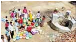
ਵਿੱਚ ਖਾਣੀ ਦਾ ਸੰਕਟ, ਕਾਲ ਦਾ ਸੰਕਟ ਦੇ ਆਧਾਰ ਉੱਤੇ ਰਿਪੋਰਟ ਦਿੱਤੀ ਗਈ ਹੈ।

ਵਾਸ਼ਿੰਗਟਨ, 6 ਅਗਸਤ (ਪੋਸਟ ਬਿਊਰੋ)- ਭਾਰਤ ਉਨ੍ਹਾਂ 17 ਦੇਸ਼ਾਂ ਵਿੱਚ ਸ਼ਾਮਲ ਹੈ, ਜਿਥੇ ਰੁੱਖਾਂ ਦੀ ਗਿਣਤੀ ਕੁੱਲ ਆਬਾਦੀ ਦਾ ਚੌਥਾ ਹਿੱਸਾ ਹੈ ਤੇ ਖਾਣੀ ਦੇ ਗੰਭੀਰ ਸੰਕਟ ਦਾ ਸਾਹਮਣਾ ਕਰ ਰਹੇ ਹਨ। ਸੰਸਾਰ ਦੇ 198 ਦੇਸ਼, ਉਨ੍ਹਾਂ ਦੇ ਸੂਬੇ ਤੇ ਪਿੰਡਾਂ